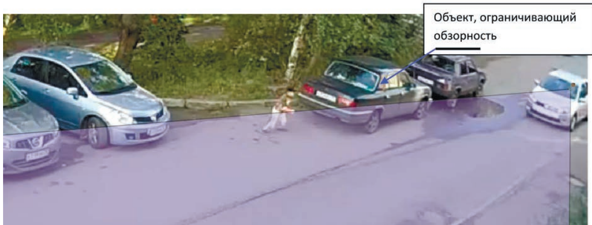
Рис. 1. Ограничение сектора обзора водителю автомобиля при движении Fig. 1. Obstruction of the moving vehicle driver's field of view